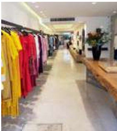
Ka Store | Rio de Janeiro - RJ