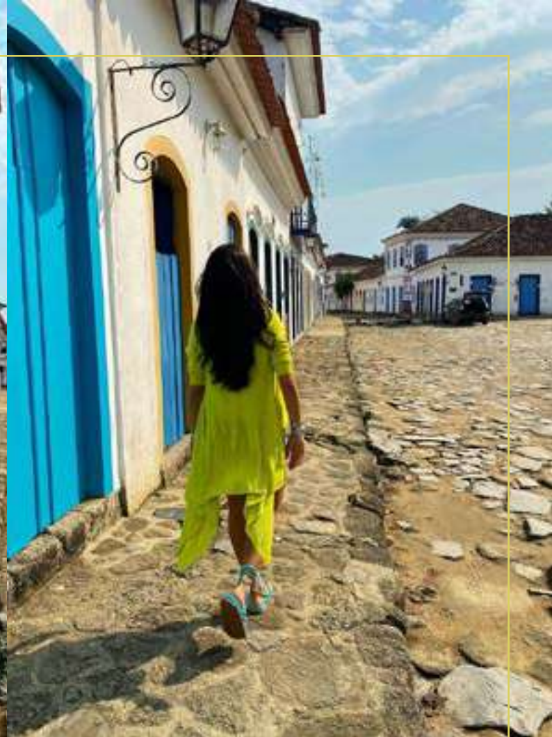
@giovanna_menegon veste VF para o programa Design & Cultura da TV Cultura no RJ