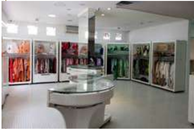
Raiana Boutique | Curitiba - PR