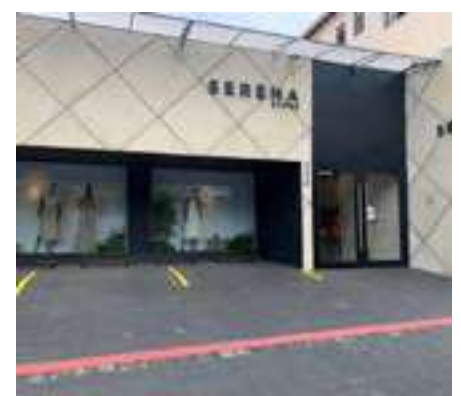
Serena Store | Belo Horizonte - MG