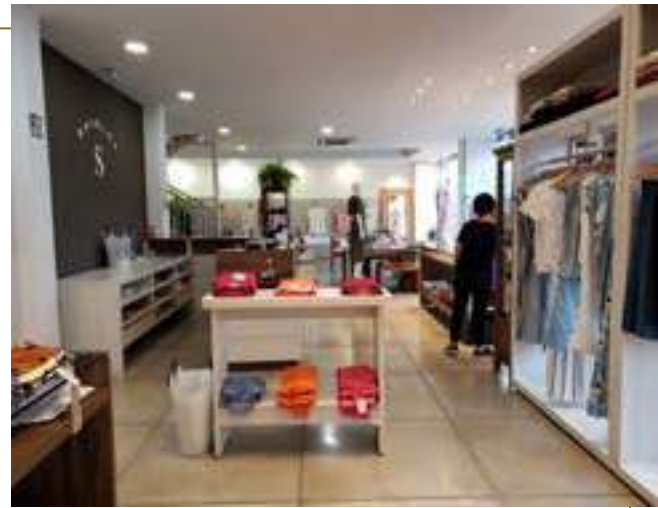
Shirley Modas | Curitiba - PR