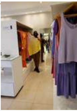
Tacon | Curitiba - PR