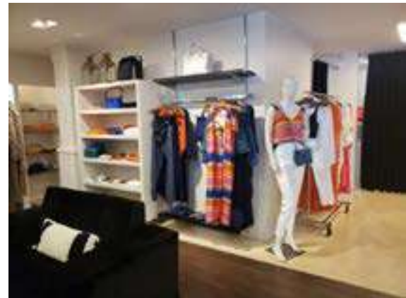
Fernanda Mourão | Brasília - DF