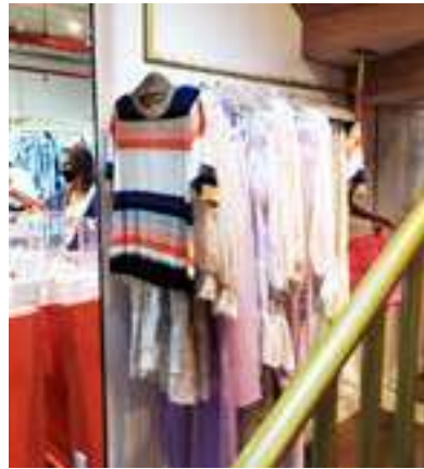
Beth Brands | Brasília - DF