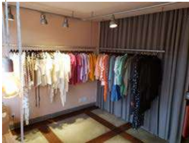
La tienda | Porto Alegre - RS